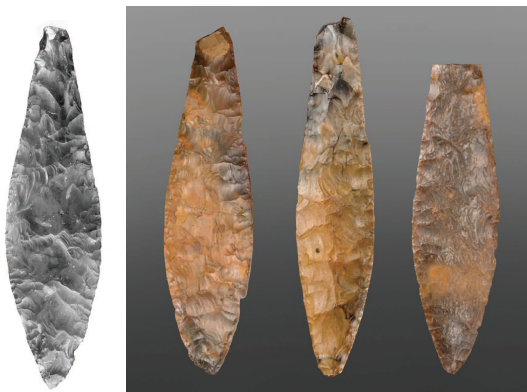
Dolk 3 (verdwenen) en dolken 6, 7 en 8

De dolken zijn gevonden tussen 1953 en 1963 op een perceel ten noordwesten van Anderen grenzend aan het Scheebroekerloopje.